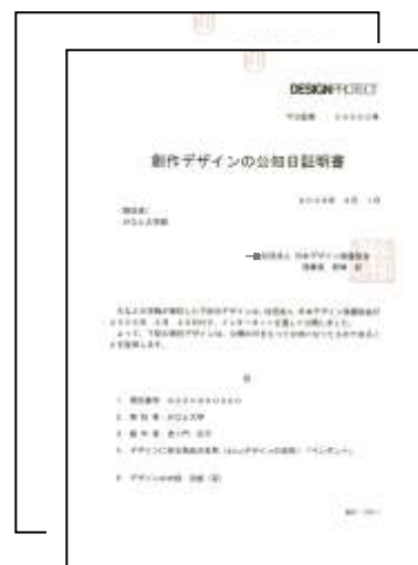
② 寄託証明書・公知日証明書