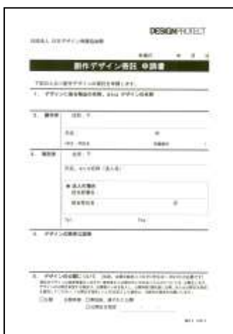
③ 創作デザイン寄託申請書