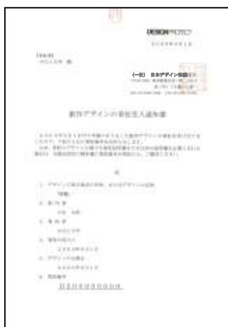
④ 創作デザイン寄託受入通知書